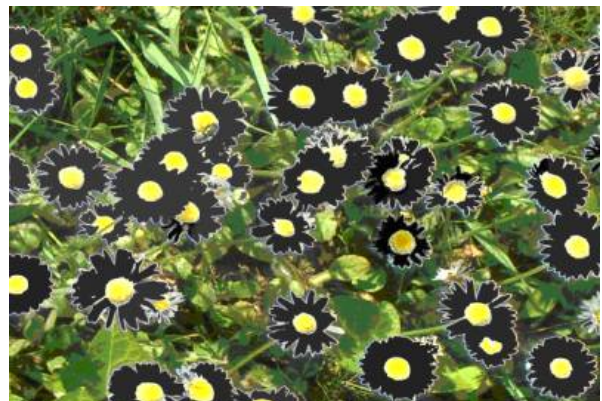
Abbildung 3: Viel Schwarz und viel Lichtabsorption mit vielen Gänseblümchen