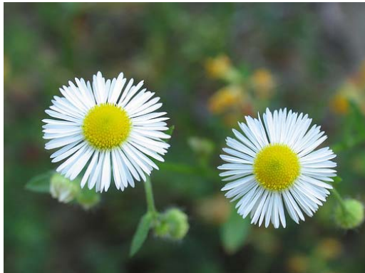
Abbildung 1: Gänseblümchen (Daisies)

Das Gaia-Prinzip ist eine Hypothese, unsere Erde als Ganzes als Lebewesen zu betrachten 1 . Diese Hypothese wurde vom Chemiker, Biophysiker und Mediziner James Lovelock und der der Mikrobiologin Lynn Margulis etwa um die Mitte der 1960er Jahre entwickelt und kann heute als Theorie gelten. Mit dem sehr einfachen Modell von Daisyworld haben die beiden einen Aspekt des Temperaturverhaltens anschaulich gemacht– Lovelock spricht bei diesem Modell klar von einer Karikatur von Gaia.